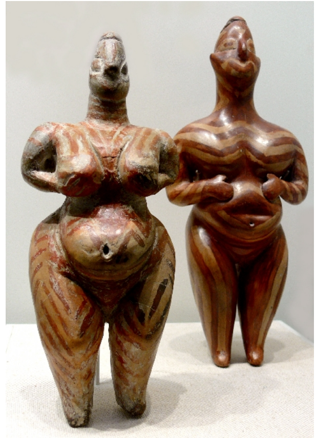
Dea lactans of dea nutrix