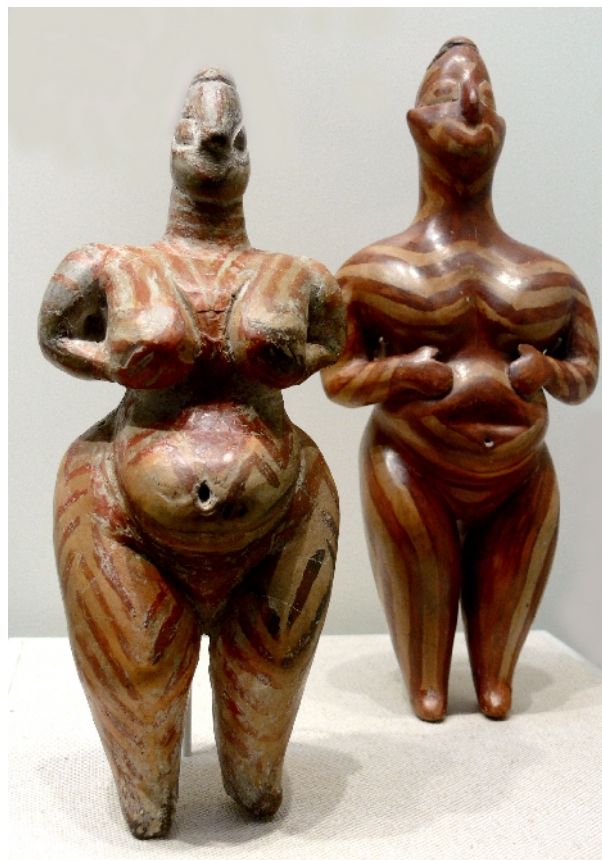
Dea lactans of dea nutrix